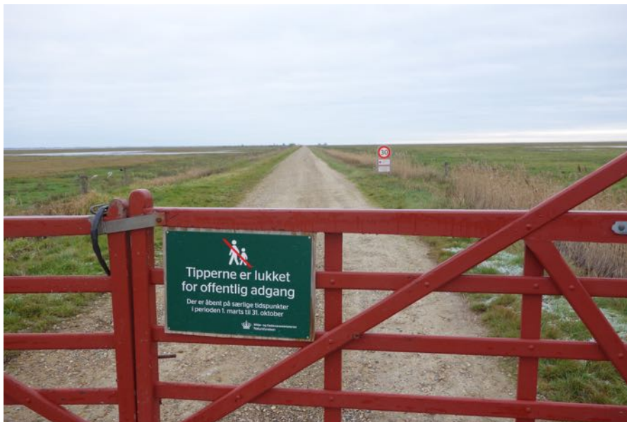
Tipperne, Ringkøbing Fjord.