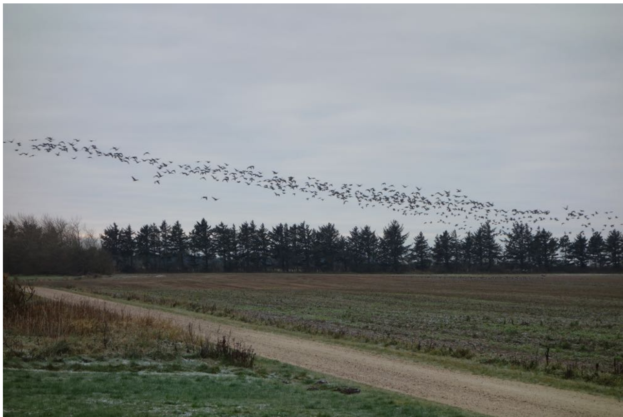
Fugle omkring Skjern Å, foto kb.

Seminaret blev traditionen tro afsluttet med en livlig diskussion over et glas vin.